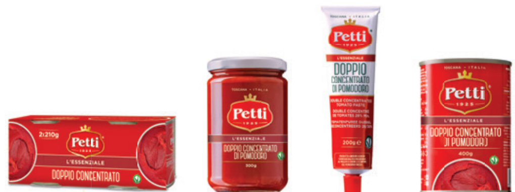
2x210g / 210g