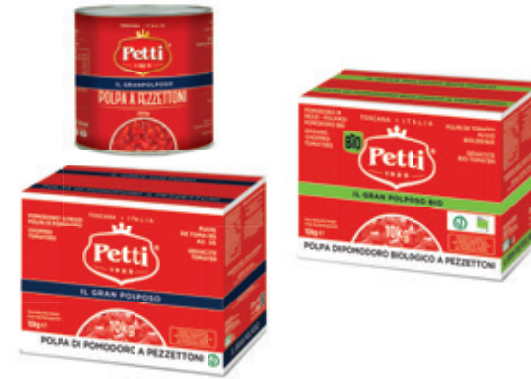
IL GRAN POLPOSO E IL GRAN POLPOSO BIO

Polpa di pomodoro a pezzettoni Chopped tomatoes Pulpe de tomates