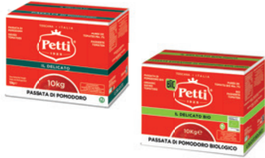
IL DELICATO E IL DELICATO BIO

Passata extrafine di pomodoro Extra fine sieved tomatoes Purée de tomates extrafine