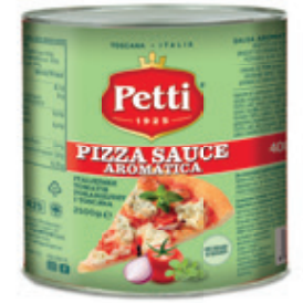
PIZZA SAUCE AROMATICA

Salsa di pomodoro per pizza Pizza tomato sauce Sauce tomate pour pizza