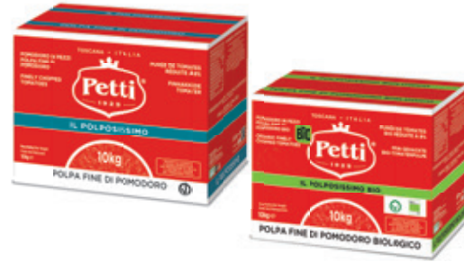
IL POLPOSISSIMO E IL POLPOSISSIMO BIO

Polpa fine di pomodoro Finely chopped tomatoes Tomates pelées concassées fines