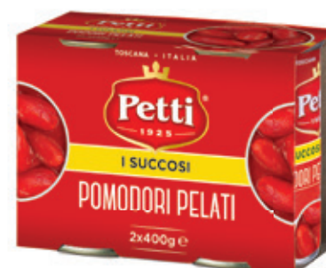
3x400g / 2x400g