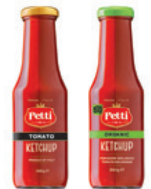
KETCHUP KETCHUP BIO