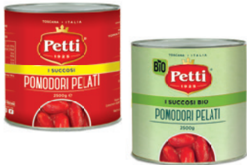
I SUCCOSI E I SUCCOSI BIO

Pomodori pelati Peeled tomatoes Tomates pelées