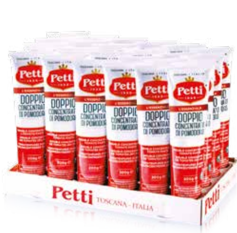
24x200g / 24x150g / 24x130g