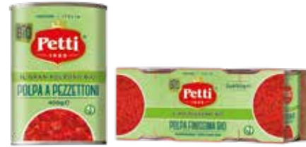
IL GRAN POLPOSO BIO IL POLPOSISSIMO BIO

Polpa di pomodoro biologico Organic chopped tomatoes Pulpe de tomates biologiques