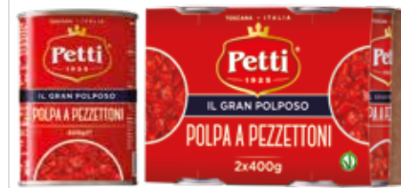
IL GRAN POLPOSO

Polpa a pezzettoni Chopped tomatoes Pulpe de tomates