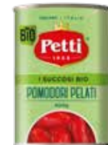
I SUCCOSI BIO

Pomodori pelati biologici Organic peeled tomatoes Tomates pelées biologiques