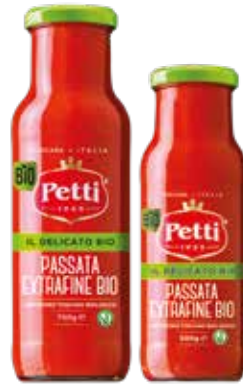
IL DELICATO BIO