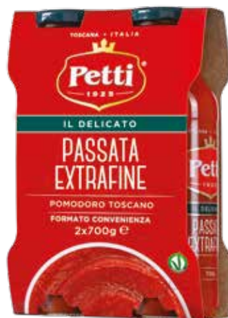
2x700 / 2x350g