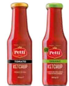
KETCHUP E KETCHUP BIO