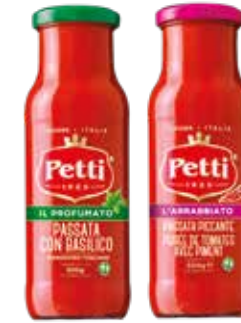
IL PROFUMATO L'ARRABBIATO