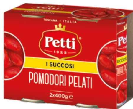
3x400g / 2x400g